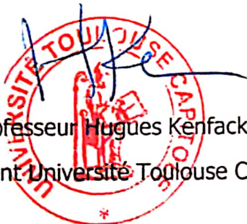
Professeur Hugues Kenfack Président Université Toulouse Capitole

La participation à la session est gratuite mais les frais divers liés à celle-ci sont exclusivement à la charge des candidats.